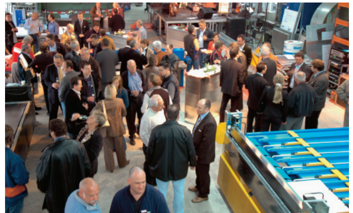
Reges Interesse von Kunden aus dem Grossraum Aargau/Zürich anlässlich der Einweihung.

neuem Elan zukunftsorientiert gestartet. Nebst Fertigung nach traditionellem Handwerk bedeutet die automatische Kanalmaschine, dass das Unternehmen seiner Kundschaft moderne und vielseitige Technologie anbietet: ein Garant dafür, dass man auch in der Zukunft wettbewerbsorientierte Leistungen erbringen kann. So beispielsweise für die Perron-Entrauchung im Flughafen Zürich: innert kürzester Frist werden auf der neuen Maschine rund 1000 Meter Kanäle produziert! ■