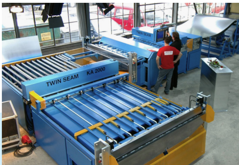
Die neue Anlage im Überblick.